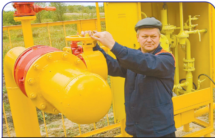
На сегодняшний день уровень газификации природным газом юга Тюменской области составляет 86,8%, ХМАО - 38%, ЯНАО - более 40%.

Еще один глобальный аспект деятельности Северрегионгаза - программа энергосбережения. Для компании энергосбережение - это прежде всего прозрачность, то есть ситуация, когда в работе с конечным потребителем услуги исчезает понятие «разбаланса». Для выявления неучтенных потерь газа на территории Тюменской области с 2007 года работает программа Газпрома «Автоматизированная система коммерческого учета газа» (АСКУТ). В ее основе - точный учет, позволяющий провести полный анализ потребления и использования газа потребителем и в конечном итоге сократить платежи за газ.